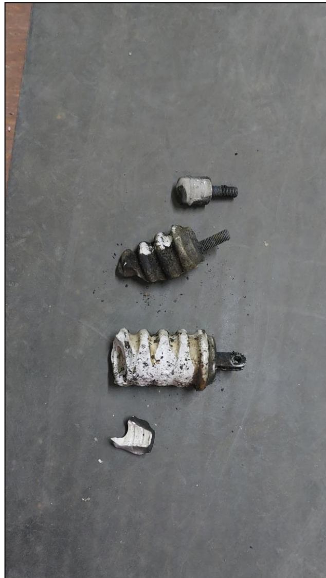
Изоляторы линейного разъединителя ЛР-1, демонтированные электромонтёром до несчастного случая

В 15:00 электромонтёр самовольно (без получения команды вышестоящего административно-технического персонала) прибыл на РП-25, открыл РУ-10 кВ РП-25, зашёл внутрь и приступил к ремонту поврежденного оборудования ячейки