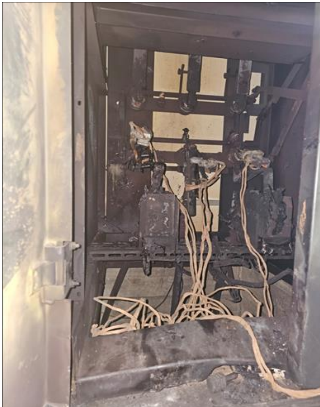
Ячейка № 1, в которой произошёл несчастный случай. Шины в верхней части ячейки находились под напряжением во время производства работ

Работники скорой медицинской помощи по окончании осмотра констатировали смерть.