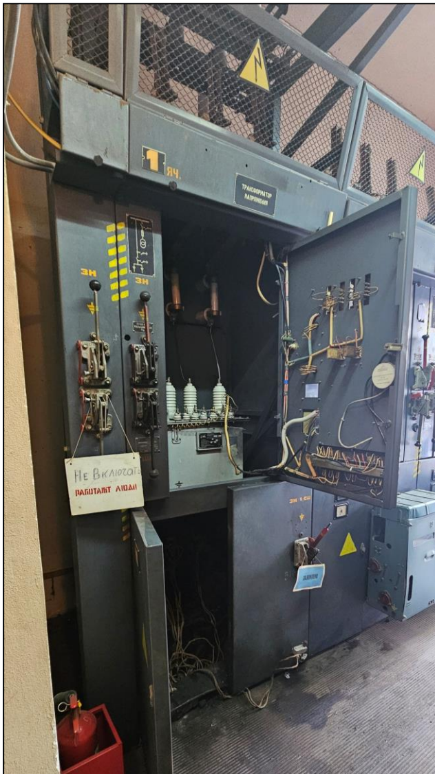
Ячейка № 1, в нижнем отсеке которой произошёл несчастный случай